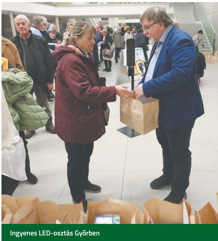
Ingyenes LED-osztás Győrben

Lantos Csaba energiaügyi miniszter beszédében felidézte: a rendezvény jelmondata a hatékonyság. „A hatékonyság a fő erő, hiszen hiába adunk támogatásokat, ha nem tudunk hatékonyan dolgozni. Ez a cég azért is figyelemre méltó, mert kiemelten foglalkozik a kutatásfejlesztéssel, amelyre a magyar kor-