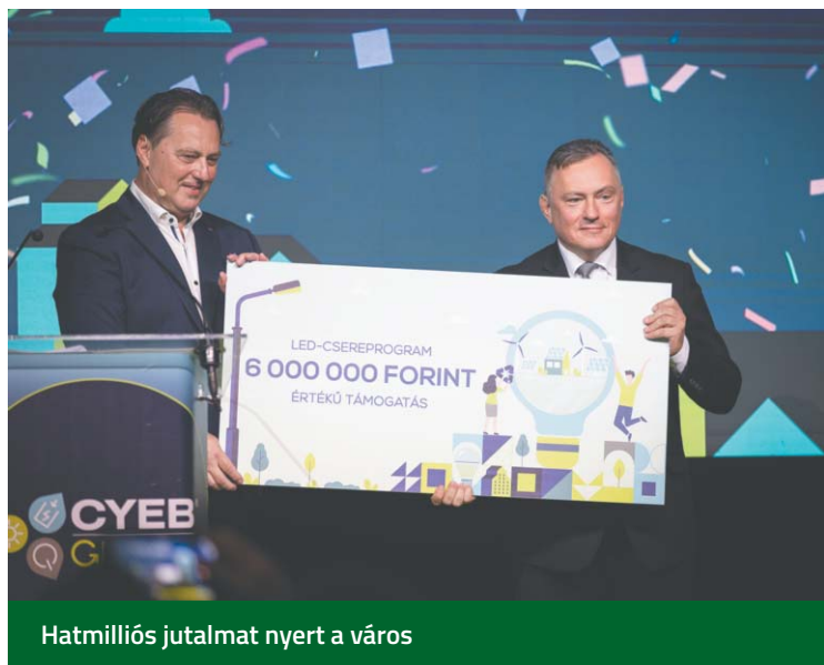
Hatmillió forint jutalmat nyert a város

mány energiapolitikája is fókuszál. Nem gondolhatjuk azt, hogy feltétlenül előrelátunk a jövőbe, ezért arra kell tennünk a hangsúlyt, hogy különböző technika mentén építsük azt.” A politikus kitért arra is, hogy a globális felmelegedés ellen tenni kell.