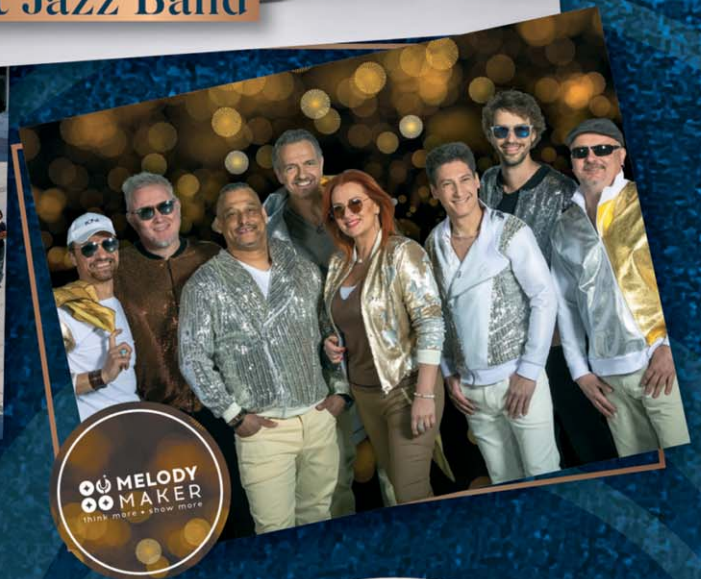
OO MELODY OO MAKER think more - show more