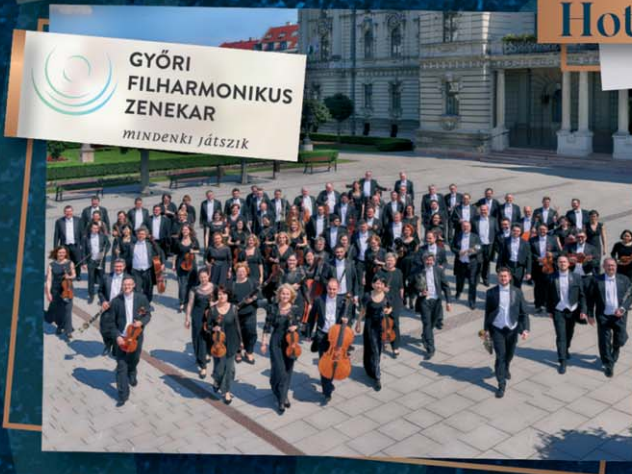
GYŐRI FILHARMONIKUS ZENEKAR mindenki játszik