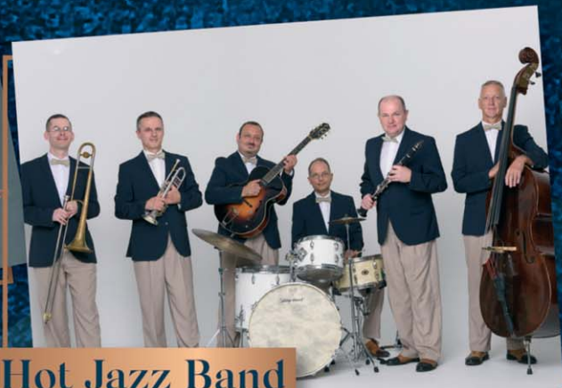
Hot Jazz Band