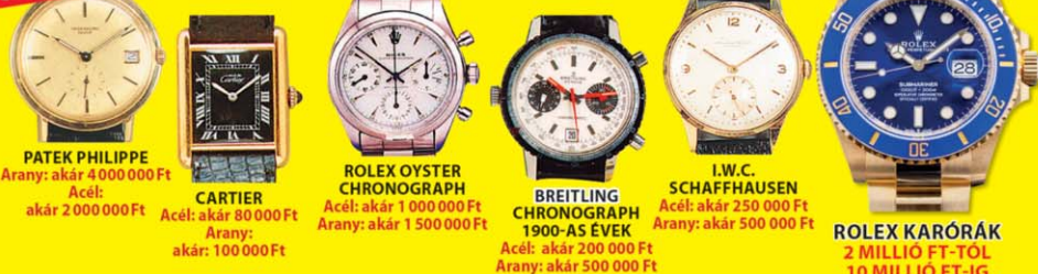
PATEK PHILIPPE Arany: akár 4 000 000 Ft Acél: akár 2 000 000 Ft

Felvásárlási árak 100 000-300 000 Ft-ig! (akár hibásat is)