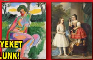
Márffy Ödön Barabás Miklós