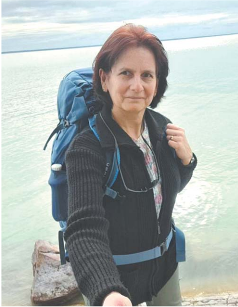
Szerző: Havassy Anna Katalin

Hazánk bővelkedik a szebbnél szebb helyekben, amelyek kerékpárral vagy akár gyalogosan is megközelíthetők. A két lábon megtett kilométerek szerelmese a győri Nagy Miklósné Helga, aki nemrég a Balatont túrázta körbe.