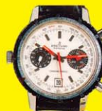
BREITLING CHRONOGRAPH 1900-AS ÉVEK Acél: akár 200 000 Ft Arany: akár 500 000 Ft