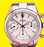
ROLEX OYSTER CHRONOGRAPH Acél: akár 1 000 000 Ft Arany: akár 1 500 000 Ft