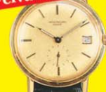
PATEK PHILIPPE Arany: akár 4 000 000 Ft Acél: akár 2 000 000 Ft