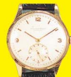
I.W.C. SCHAFFHAUSEN Acél: akár 250 000 Ft Arany: akár 500 000 Ft