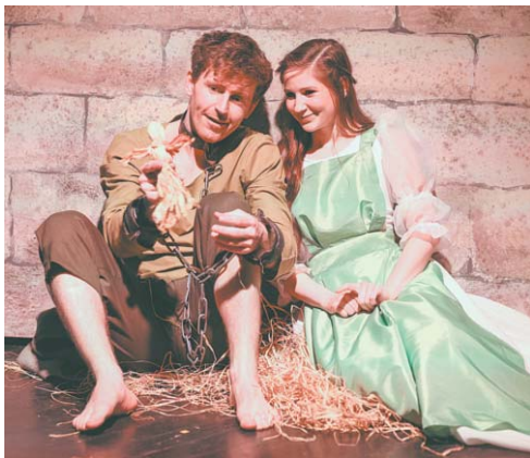
Szerző: P. Csapucha Adrienn

Az elmúlt hétvégén az évad zárásaként ösbemutatót tartott a teátrum. A kapuvári lápi lény története elevenedik meg a Kisfaludy Teremben, Hanyistók legendáját Kszel Attila álmodta színpadra. A fordulatokban gazdag előadás jócskán rejteget izgalmakat és vidám pillanokat.