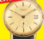
PATEK PHILIPPE Arany: akár 4 000 000 Ft Acél: akár 2 000 000 Ft