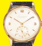
I.W.C. SCHAFFHAUSEN Acél: akár 250 000 Ft Arany: akár 500 000 Ft