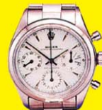
ROLEX OYSTER CHRONOGRAPH Acél: akár 1 000 000 Ft Arany: akár 1 500 000 Ft