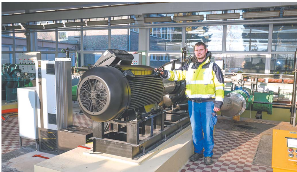
Szöveg és fotó: Pannon-Víz Zrt./Borsi Viktória

T avaly egy energiahatékonysági pályázat keretében társaságunk szőgyei vízműtelepén egy új, nagy kapacitású hálózati szivattyút telepített. Ez a korszerű eszköz közel negyvenéves elődjét váltotta fel, amelyet a telep megépítését követően építettek be, és lett Győr és agglomerációja vízellátásának egyik meghatározó alappillére.