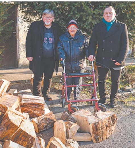
Szerző: Földvári Gabriella

Mint ismeretes, az önkormányzat tűzifát biztosít azoknak a győrieknek, akik szociálisan rászorulnak, és akik önhibájukon kívül nem tudnak gondoskodni a téli tüzelőjükről. A felhívásra közel százan jelentkeztek, ők összesen 430 köbméter fát kapnak.