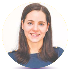
Szerző: Bényes-Molnár Réka dietetikus, TudásÉpítők