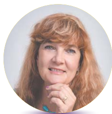
Szerző: Füves Zsuzsa mentálhigiénés szakember, tréner, coach, tanácsadó

Egy stresszes vagy frusztrált légkörű családban nehéz kialakítani a családtagok összhangját. Csak kölcsönös tisztelet és megértés alakíthat ki összhangot. A hozzáállásunkon és szándékunkon sok múlhat a munkahelyi és családi szinten is. Természetesen a mindennapokban nem szükséges mindenkivel összhangban lennünk. Bizony vannak olyan kapcsolatok, ahol az egymás megértésének a szintje alacsonyabb. A tisztelet megadása itt is fontos szempont.