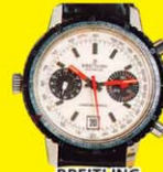
BREITLING CHRONOGRAPH 1900-AS EVEK Acél: akár 200 000 Ft Arany: akár 500 000 Ft