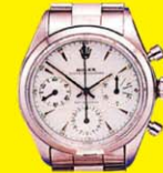
ROLEX OYSTER CHRONOGRAPH Acél: akár 1 000 000 Ft Arany: akár 1 500 000 Ft