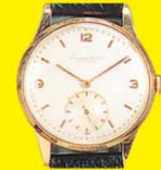
I.W.C. SCHAFFHAUSEN Acél: akár 250 000 Ft Arany: akár 500 000 Ft