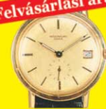
PATEK PHILIPPE Arany: akár 4 000 000 Ft Acél: akár 2 000 000 Ft