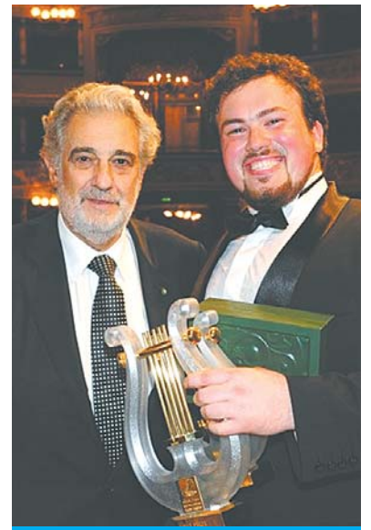
Plácido Domingo, Stefan Pop

fényfelelős ezúttal is a legendás zenész, Frenreisz Károly lesz.