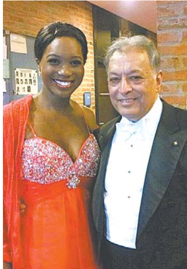
Angel Blue, Zubin Metha

A 2014-es verseny utolsó fordulói az Oscar Gála egykori helyszínén, a Dorothy Chandler Pavilionban található Los Angeles Operában kerülnek megrendezésre. Az Operalia döntőit hagyományosan, így az idei augusztus 30-i eseményt is Plácido Domingo vezényli.